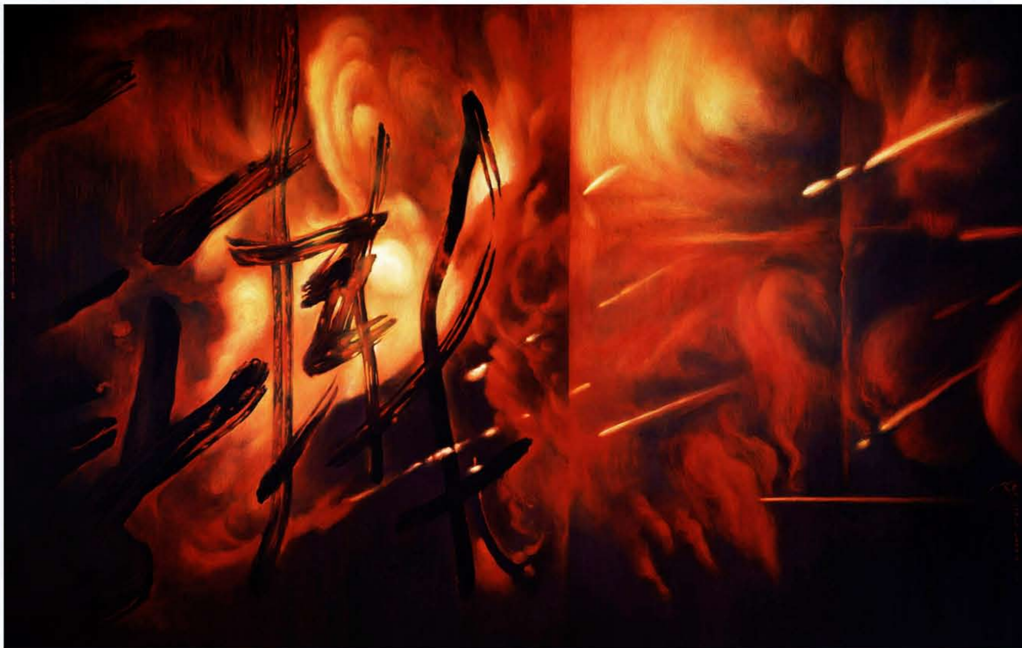
梁藍波《裂變·構成》II·丙烯帆布綜合媒材·119.4×188 cm·2012年。

記憶，一層層地剝蝕。然而，時間的靈光卻一次次地在永恆的藝術中閃動，一次次地令人類永遠地追懷。如果說，梁藍波的《雲·山·夢》和《歲月·遐想》系列對東方的追懷和表達手法的應用都存在著較為理性、較為刻意為之的痕跡的話，那麼，他近期的《聚合大系》則顯示出東方文化的自然和大度，較自由地體現著他的一種藝術理想——東西方文化在一個新的層面上的「聚合」。