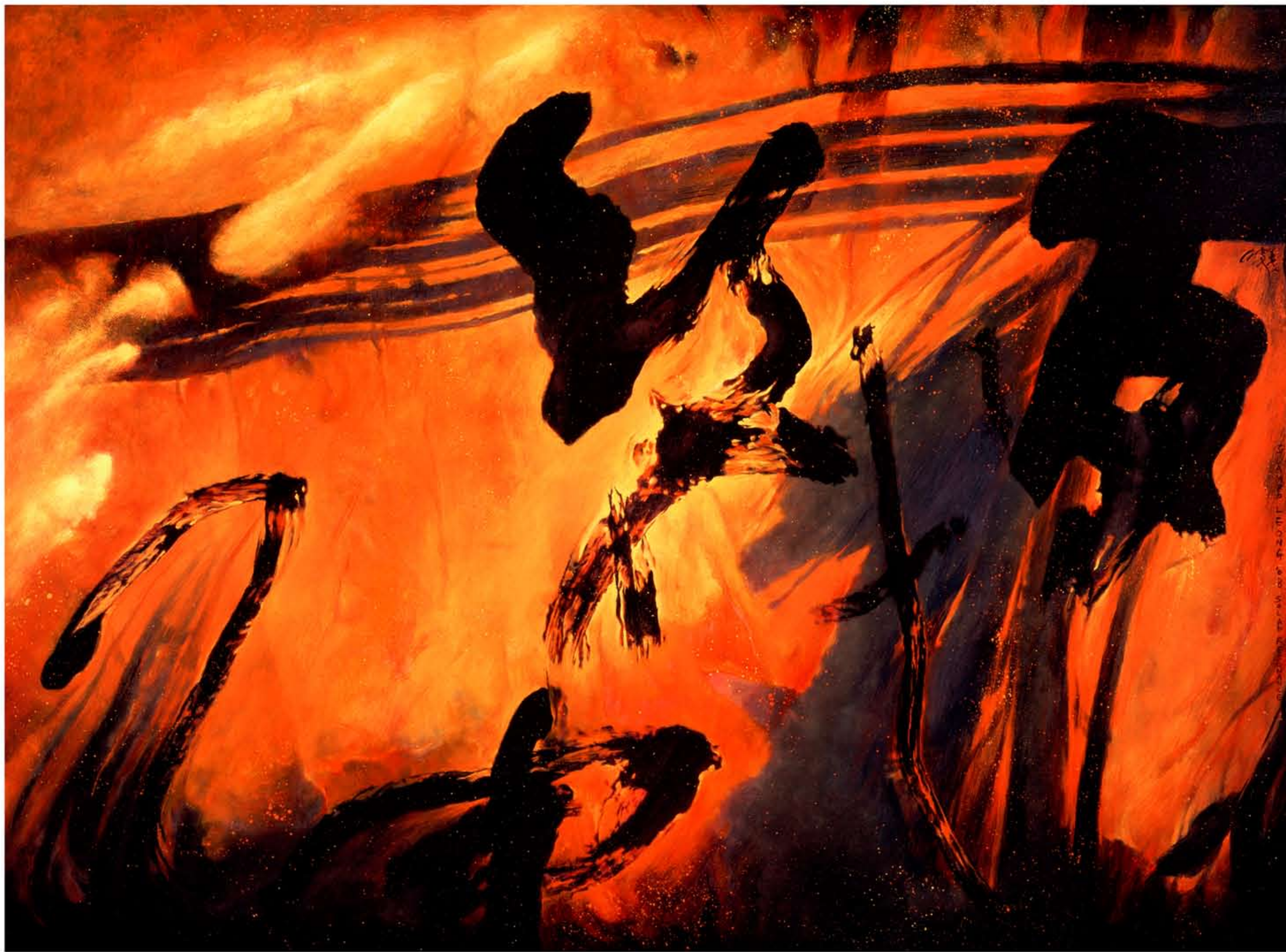
回声之一 综合材料/86cmX117cm/2005 动势之十 综合材料/84cmX127cm/2005