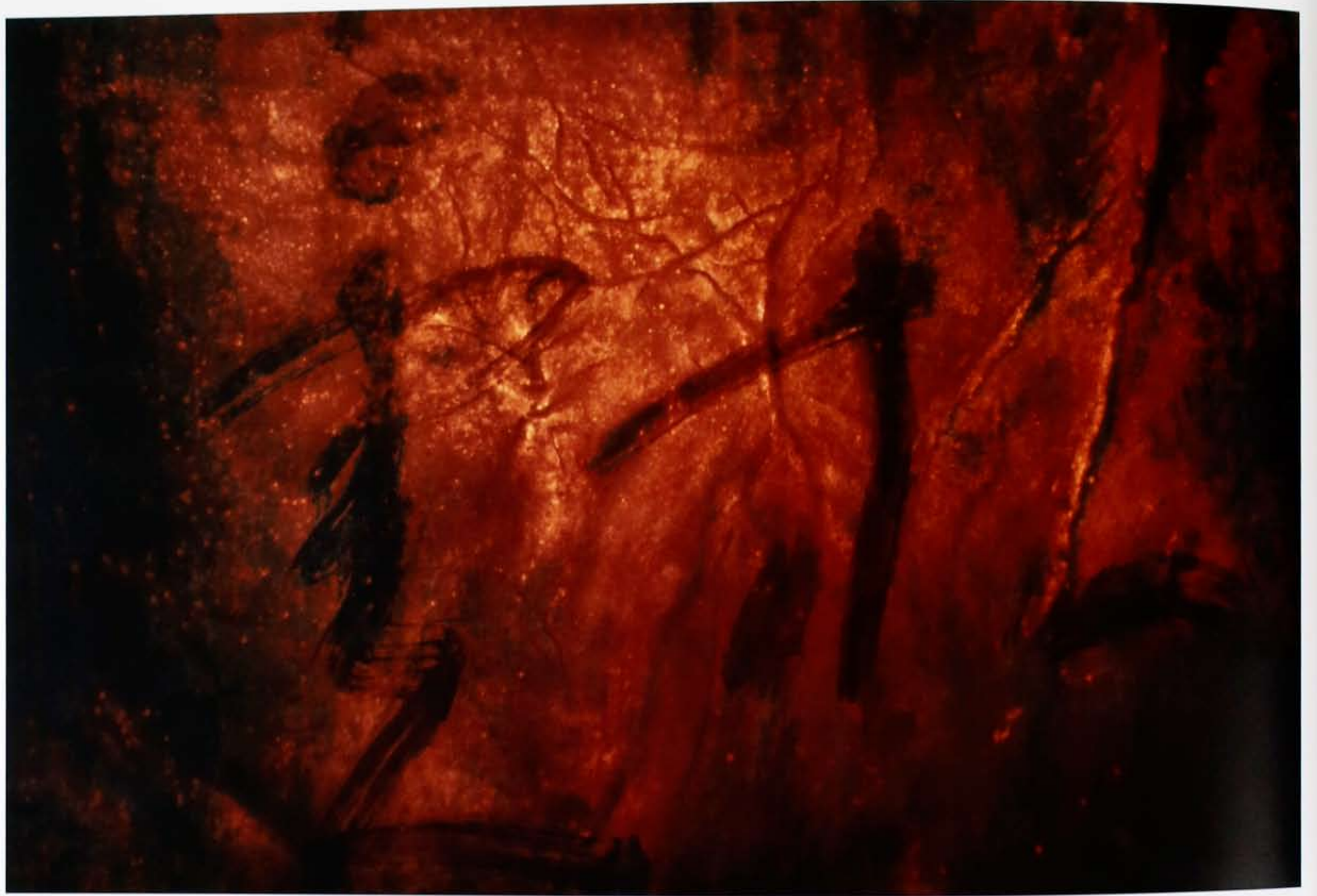
梁藍波 《天籟》I 2010 紙本綜合媒材 86 × 129.5 cm

Leong, Lam-Po 美國 United States of America