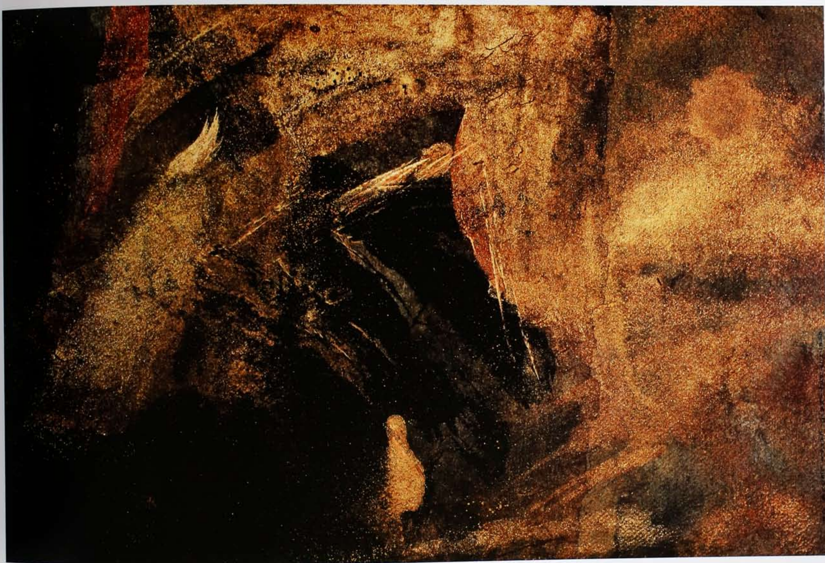
梁藍波 沉積VIII 2010 紙本綜合媒材 74 × 112 cm